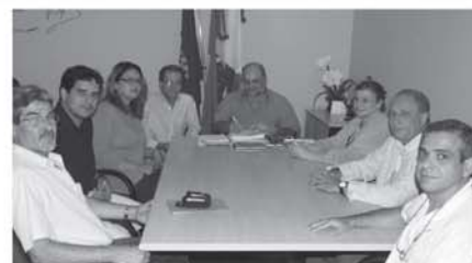
Comissão de cargos e salários, na assinatura do projeto no gabinete do prefeito Vicente Guedes.

A mensagem foi encaminhada à Câmara com pedido de urgência e deve ser votada na próxima semana, entrando em vigor a partir de 01 de dezembro.