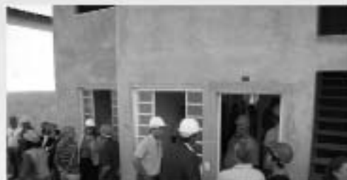
Prefeito e Secretários em frente a Casa Modelo