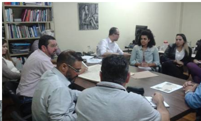
Reunião entre membros da Comissão e técnicos do CEPERJ.